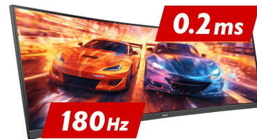
180Hz & 0.2ms MPRT

Matryca Fast IPS nie tylko gwarantuje wierne odwzorowanie scen z pola bitwy i wyjątkową dokładność kolorów, ale także niesamowity czas reakcji na ruchomy obraz (MPRT) wynoszący 0.2 ms.