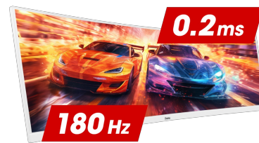
180Hz & 0.2ms MPRT

Matryca Fast IPS nie tylko gwarantuje wierne odwzorowanie scen z pola bitwy i wyjątkową dokładność kolorów, ale także niesamowity czas reakcji na ruchomy obraz (MPRT) wynoszący 0.2 ms.